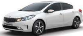
Clear White (UD)