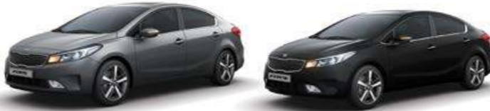
Metal Stream (MST) Aurora Black (ABP)