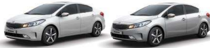
Snow White Pearl (SWP) Silky Silver (4SS)