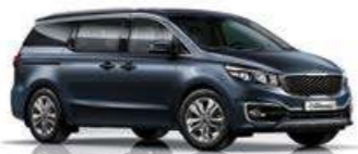
Formal Deep Blue