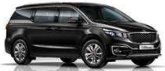
Aurora Black Pearl