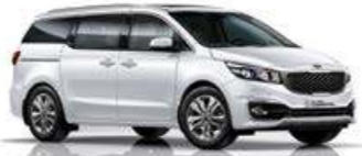
Snow White Pearl