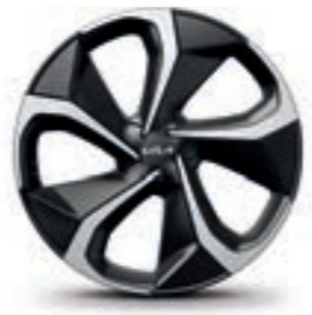
חישוקי סגסוגת 20 אינץ' (GT-line)