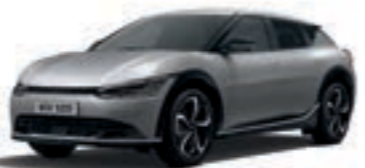
Moonscape (KLM)* צבע בתוספת תשלום*