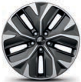
חישוקי סגסוגת 19 אינץ' (Premium)