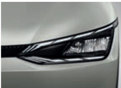
פנסים ראשיים MFR LED (בדגם Premium)