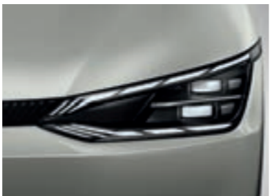
פנסים ראשיים IFS LED (בדגם GT-Line)