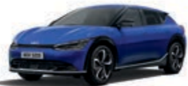
Yacht Blue (DU3)