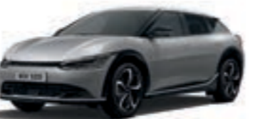
Iron Gray (KLG)