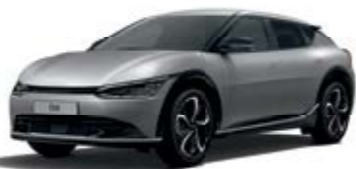
Moonscape (KLM)* צבע בתוספת תשלום*