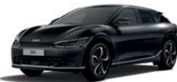
Aurora Black Pearl (ABP)