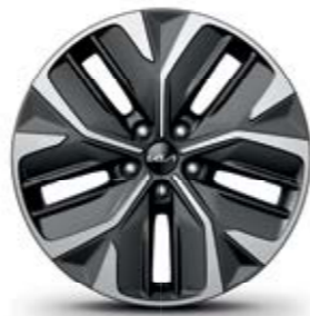
חישוקי סגסוגת 19 אינץ' (Premium)