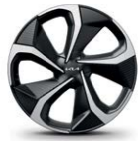
חישוקי סגסוגת 20 אינץ' (GT-line)