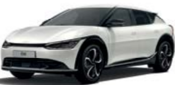
Snow White Pearl (SWP)