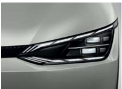
פנסים ראשיים IFS LED (בדגם GT-Line)