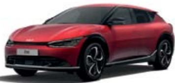
Runway Red (CR5)