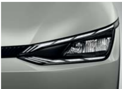
פנסים ראשיים MFR LED (בדגם Premium)