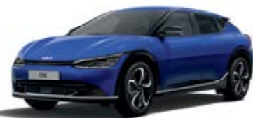
Yacht Blue (DU3)