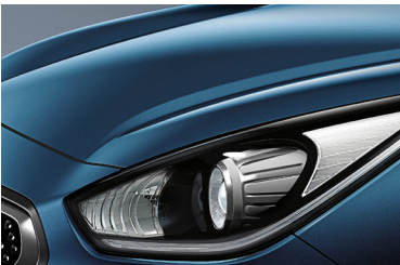
Deep Cerulean Blue (C3U)