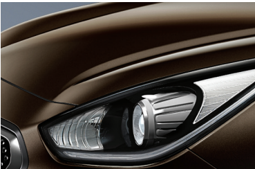
Rich Espresso (DN9)