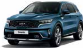
Mineral Blue (M4B)