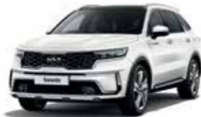
Snow Pearl White (SWP)