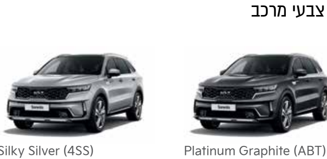
Silty Silver (4SS)