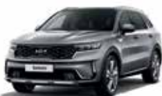
Steel Grey (KLG)