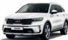
Snow Pearl White (SWP)