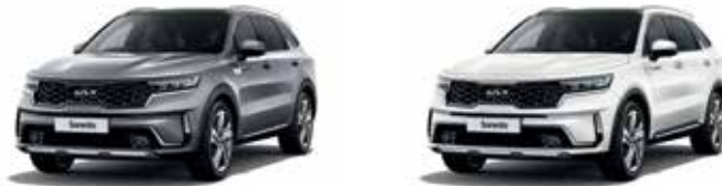
Steel Grey (KLG)