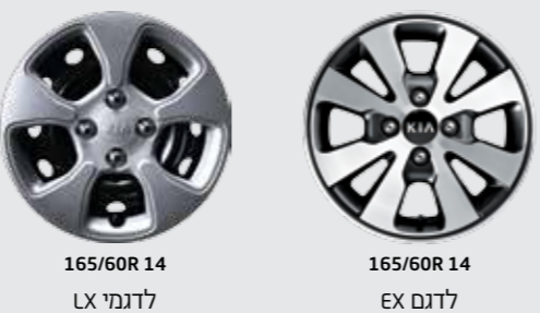
165/60R 14 LX לדגמי EX