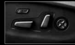
כוונון מושב נהג חשמלי* *בדגמי פרימיום בלבד