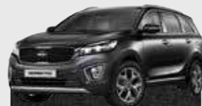
Platinum Graphite (ABT)