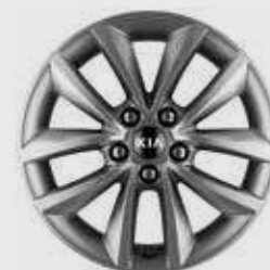
חישוק סנסוגת 17" 235/65R (בדגמי אורבן-EX)