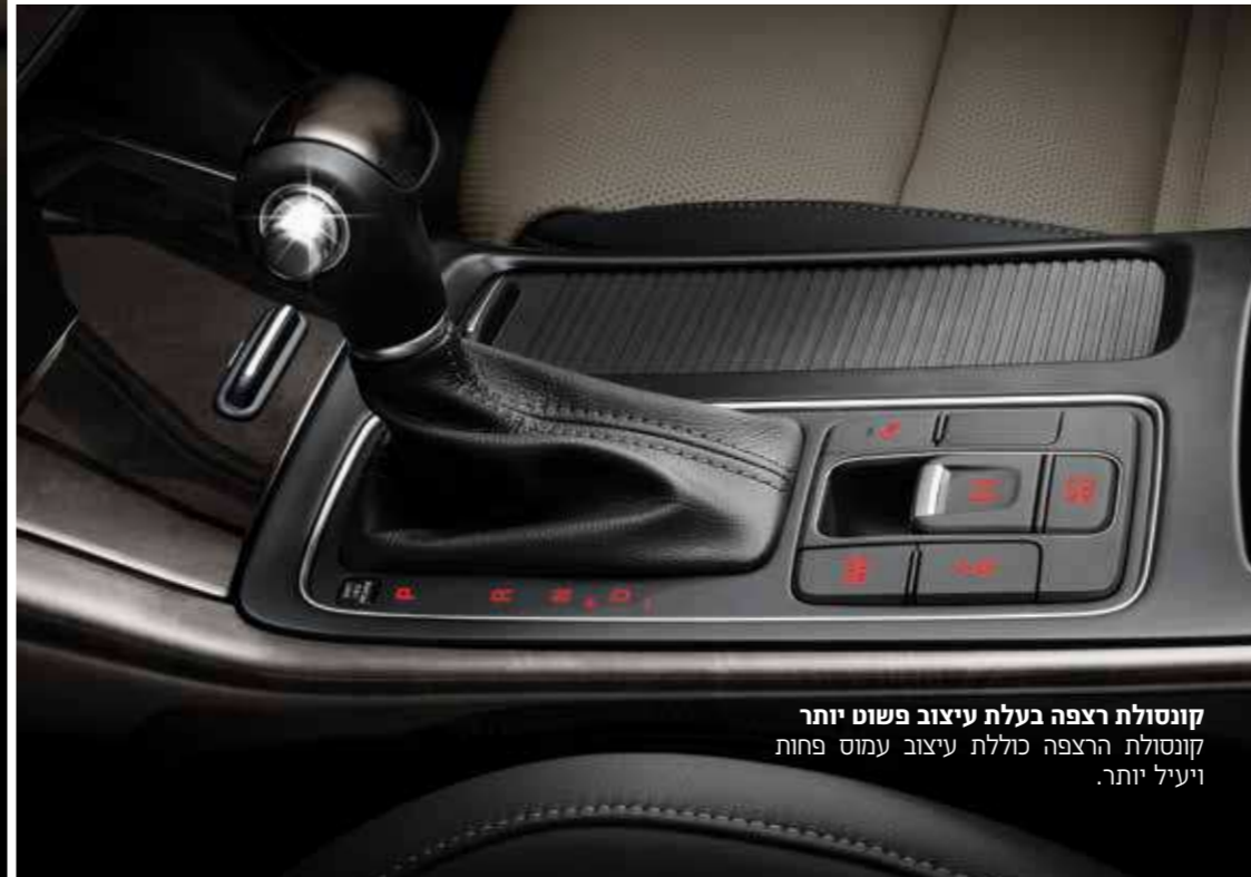
קונסולת רצפה בעלת עיצוב פשוט יותר קונסולת הרצפה כוללת עיצוב עמוס פחות ויעיל יותר.

לקיה סורנטו איכות הרכבה בלתי מתפשרת, מחוונים פשוטים ומזמינים, אוורור חזק וממוקד וחלל פנימי מרווח במיוחד, ההופכים אותו לאי של אלגנטיות שפויה, בחיי היומיום העמוסים.