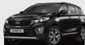
Aurora Black Pearl (ABP)