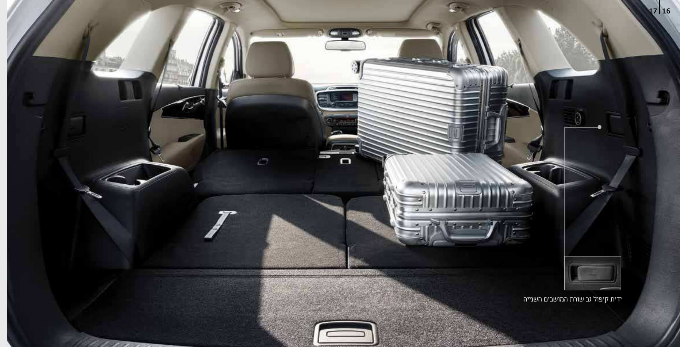
ידית קיפול גב שורת המושבים השנייה