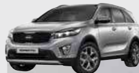
Silky Silver (4SS)