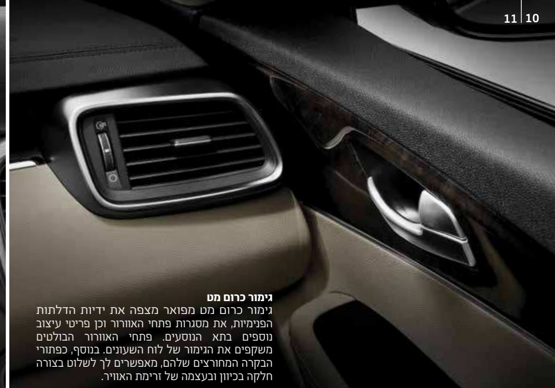
גימור כרום מט גימור כרום מט מפואר מצפה את ידיות הדלתות הפנימיות, את מסגרות פתחי האוורור וכן פריטי עיצוב נוספים בתא הנוסעים. פתחי האוורור הבולטים משקפים את הגימור של לוח השעונים. בנוסף, כפתורי הבקרה המחוברים שלהם, מאפשרים לך לשלוט בצורה חלקה בכיוון ובעצמה של זרימת האוויר.