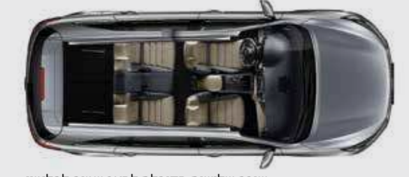
שורה שלישית מקופלת למצב שטוח לחלוטין