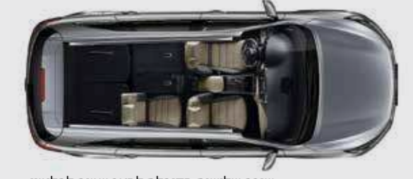
שורה שלישית מקופלת למצב שטוח לחלוטין ושורה שנייה מקופלת חלקית