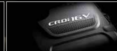
מנוע דיזל CRDi 2.2 הספק מרבי 200 כ"ס @ 3,800 סל"ד (יורו 6)