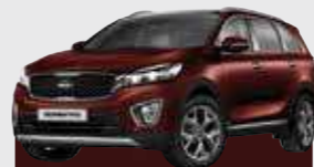
Sunset Red (MR5)