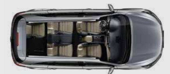
שורה שלישית מקופלת חלקית

שורת המושבים השנייה מחליקה 270 מ"מ לפניים ולאחור כדי להקל על הכניסה והיציאה של יושבי השורה השלישית.