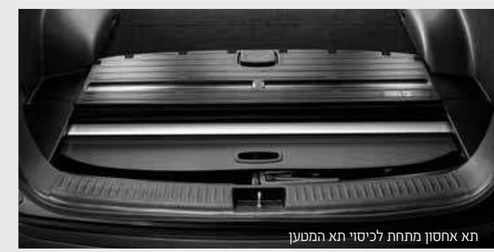
תא אחסון מתחת לכיסוי תא המטען

תא אחסון מתחת לכיסוי תא המטען אחסן חפצים יקרי ערך גדולים יותר בחלל נפרד, מתחת לכיסוי תא המטען הנשלף (אופציה).