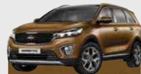
Imperial Bronze (MY3)