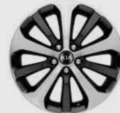
חישוק סנסוגת 18" 235/60R (בדגמי פרימיום)

חישוקי סנסוגת אווירודינמיים מסייעים להפחית את המשקל, שאינו נתמך ע"י מערכת המתלים ומדגישים את האופי החסון של קיה סורנטו.