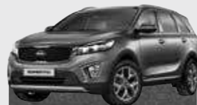
Metal Stream (MST)