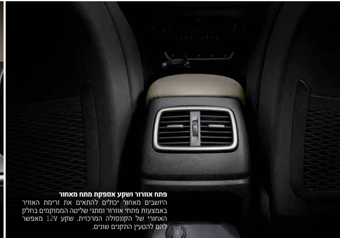
פתח אוורור ושקע אספקת מתח מאחור היושבים מאחור יכולים להתאים את זרימת האוויר באמצעות פתחי אוורור ומתני שליטה הממוקמים בחלק האחורי של הקונסולה המרכזית. שקע 12V מאפשר להם להטעין התקנים שונים.