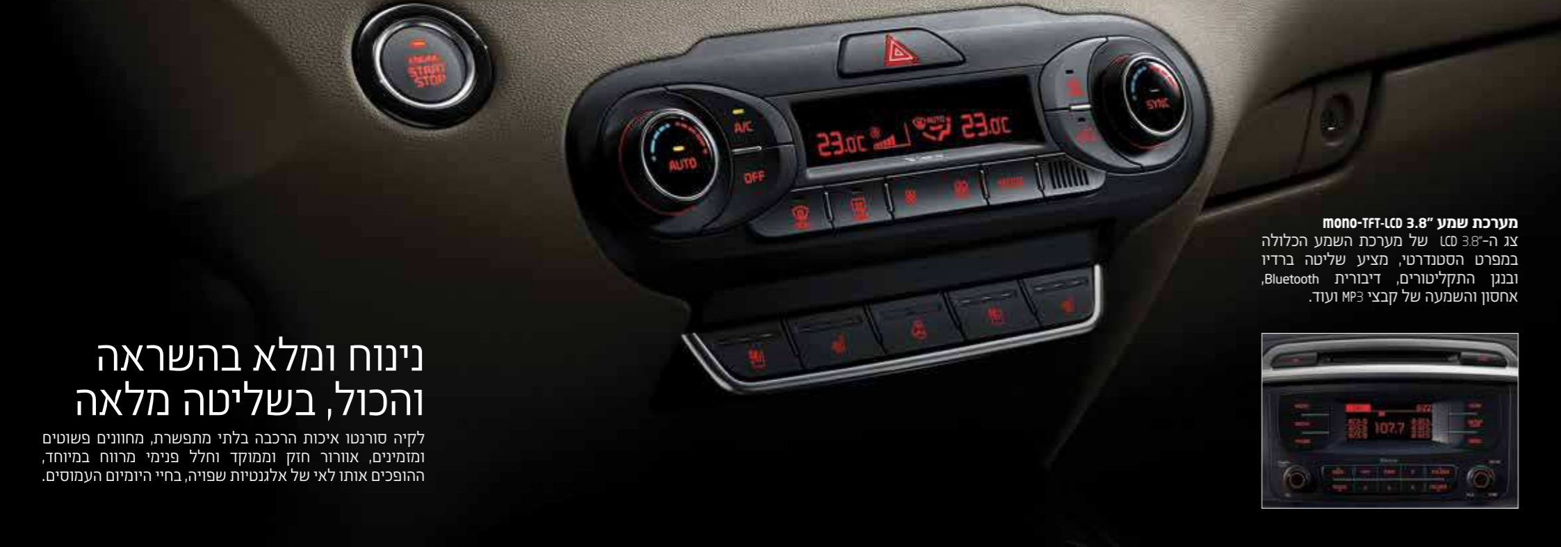
מערכת שמע 3.8" mono-TFT-LCD צג ה-3.8" LCD של מערכת השמע הכוללה במפרט הסטנדרטי, מציע שליטה ברדיו ובנגן התקליטורים, דיבורית Bluetooth, אחסון והשמעה של קבצי MP3 ועוד.