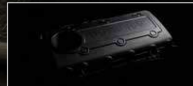
מנוע בנזין GDI 2.4 הספק מרבי 188 כ"ס @ 6,000 סל"ד (יורו 6)

מנועי הבנזין והדזל המוצעים בקיה סורנטו, מציעים מומנט מהנה בטווח הסל"ד הנמוך והבינוני, וכן פעולה חלקה ושקטה. צריכת הדלק המעולה שלהם, נעזרת בתיבות הילוכים מדויקות וחכמות, המאזנות בין כוח לחיסכון בדלק - גם כשאתה בעיר וגם כשאתה בכביש הפתוח.