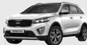
Snow White Pearl (SWP)