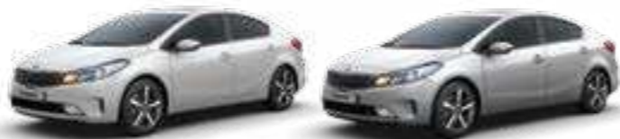
Snow White Pearl (SWP) Silky Silver (4SS)