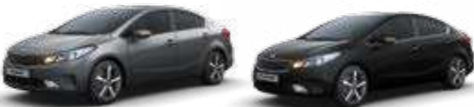
Metal Stream (MST) Aurora Black (ABP)