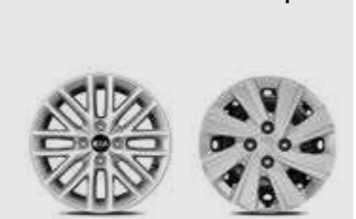
חישוקי פלדה 15" לדגמי 4 דלתות חישוקי סגסוגת קלה 15" לדגם 5 דלתות