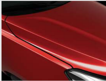
Signal Red (BEG)