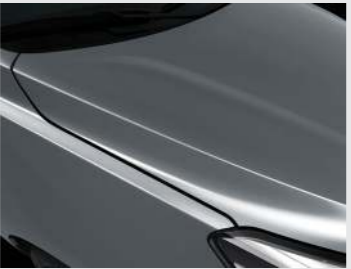
Platinum Graphite (ABT)