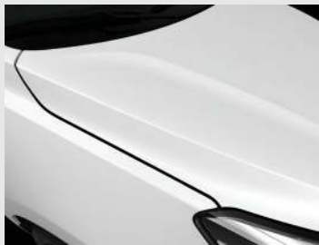
Clear White (UD)