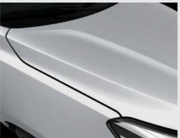
Silky Silver (4SS)