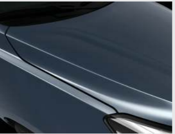
Smoke Blue (EU3)