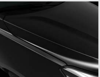
Aurora Black Pearl (ABP)