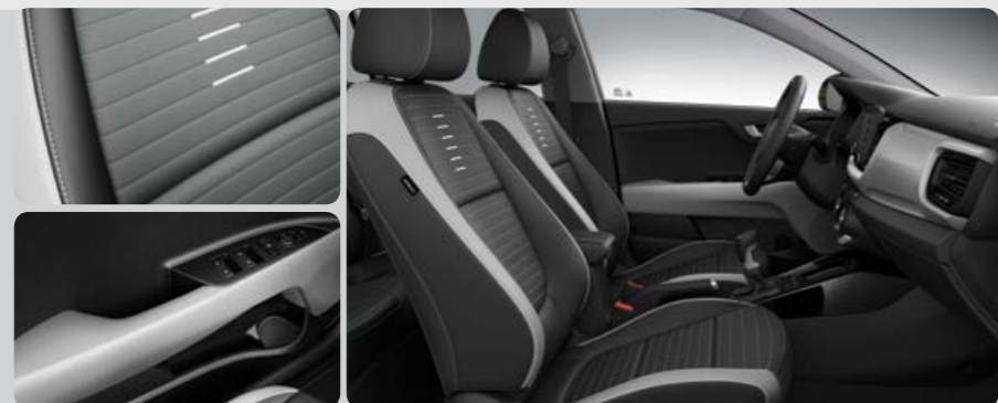
*בדגם סטוניק Premium

פנים אפור שני גוונים (חבילת Gray) מושבי עור מלאכותי בשני גוונים של אפור, בהיר ובינוני כוללים תפרים אפורים מסוגננים. שילובי בד נושם ורך בצבע אפור כוללים פסים רקומים אופקיים, ודגשים מוטבעים אפורים התואמים את הגוון האפור הבהיר יותר של חיפוי לוח המכשירים והקונסולה המרכזית ומשענות היד בלילות.