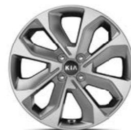
חישוקי סגסוגת 17"