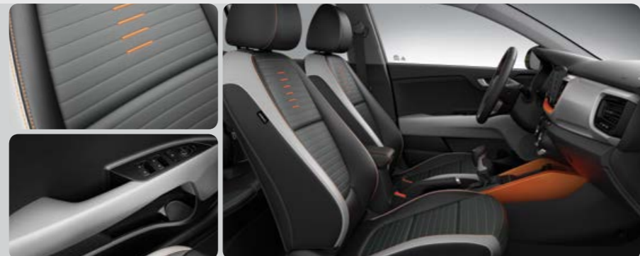
*בדגם סטוניק Premium, מרכב בצבע אפור וגם כתום

פנים אפור שני גוונים (חבילת Orange) מושבי עור מלאכותי בשני גוונים של אפור, בהיר ובינוני כוללים תפרים כתומים בהירים. שילובי בד נושם בצבע אפור כוללים פסים רקומים אופקיים ודגשים מוטבעים כתומים התואמים את הגוון הבהיר של חיפוי לוח המכשירים והקונסולה המרכזית. ידיות הדלתות הן בגוון אפור בהיר יותר.