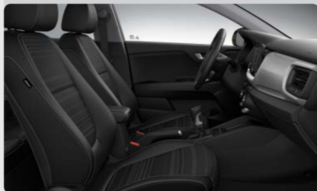
*בדגמי סטוניק EX/Urban