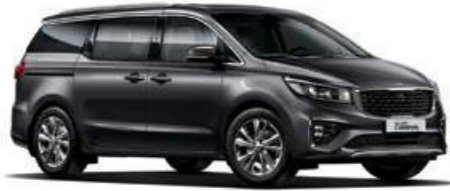
Panthera Metal (P2M)