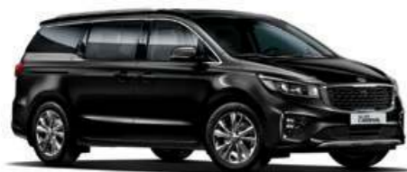
Aurora Black (ABP)