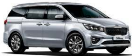
Silky Silver (4SS)