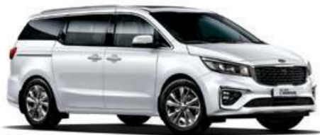
Nieve Blanca Perlada (SWP)